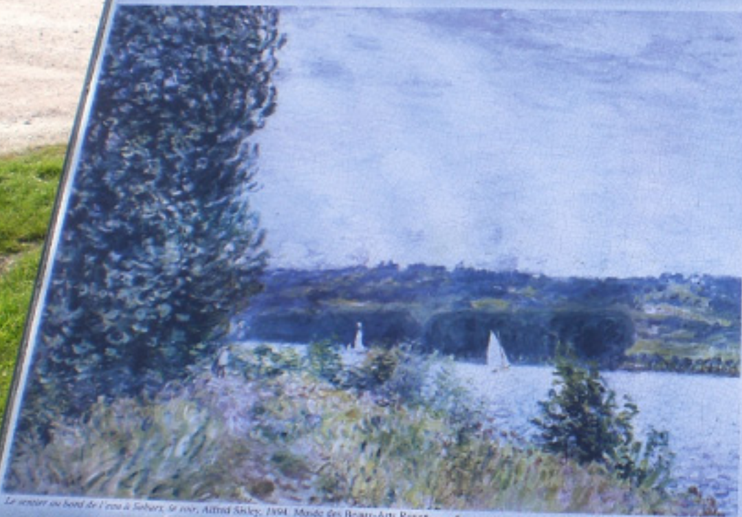
Le sentier au bord de l'eau à Sabotz, le soir, Alfred Sisley, 1894. Musée des Beaux-Arts Rouen.

Le peintre du ciel ■ Comme Eugène Boudin, que Gustave Courbet surnommait "le Roi des cieux", Alfred Sisley est fasciné par le ciel. "Le ciel ne peut jamais être en arrière plan, affirmait-il. Non seulement, il donne un rythme de la perspective grâce à ses plans horizontaux, mais il fait passer du mouvement. Provoque l'impression que l'on s'élève, et contribue toujours en tableaux au ciel."